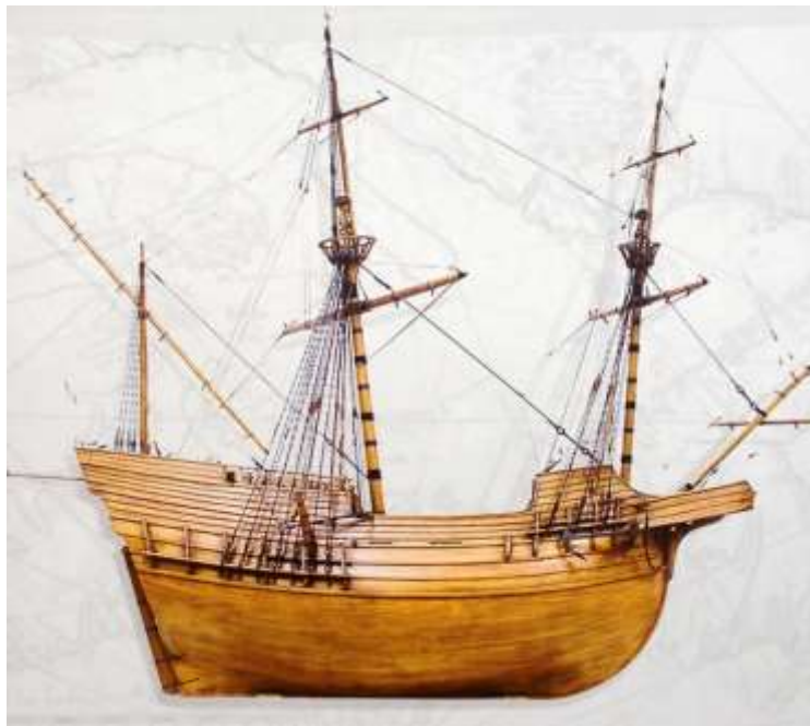
A nau São João, num modelo à escala

O foco do seu espaço de exposição foi a história da reconstrução da nau São João , um baleeiro do século XVI construído nos estaleiros do País Basco, e que tinha por função a caça à baleia nos mares gelados da Terra Nova, para aproveitamento do óleo para fins industriais.