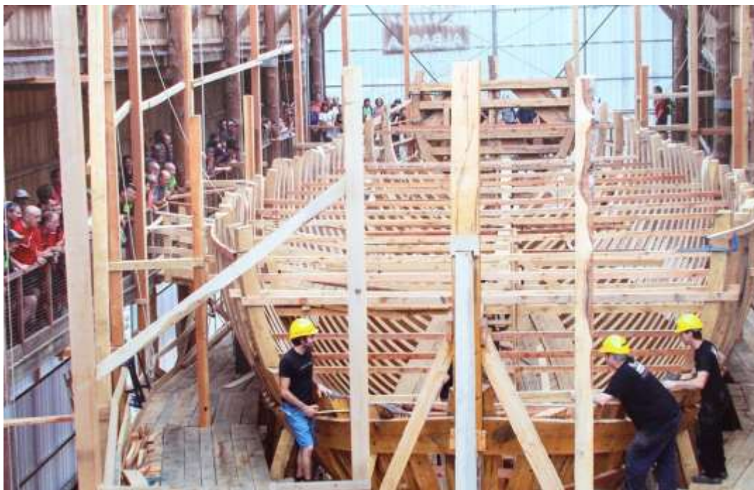
A construção da réplica da nau São João pode ser acompanhada pelos visitantes