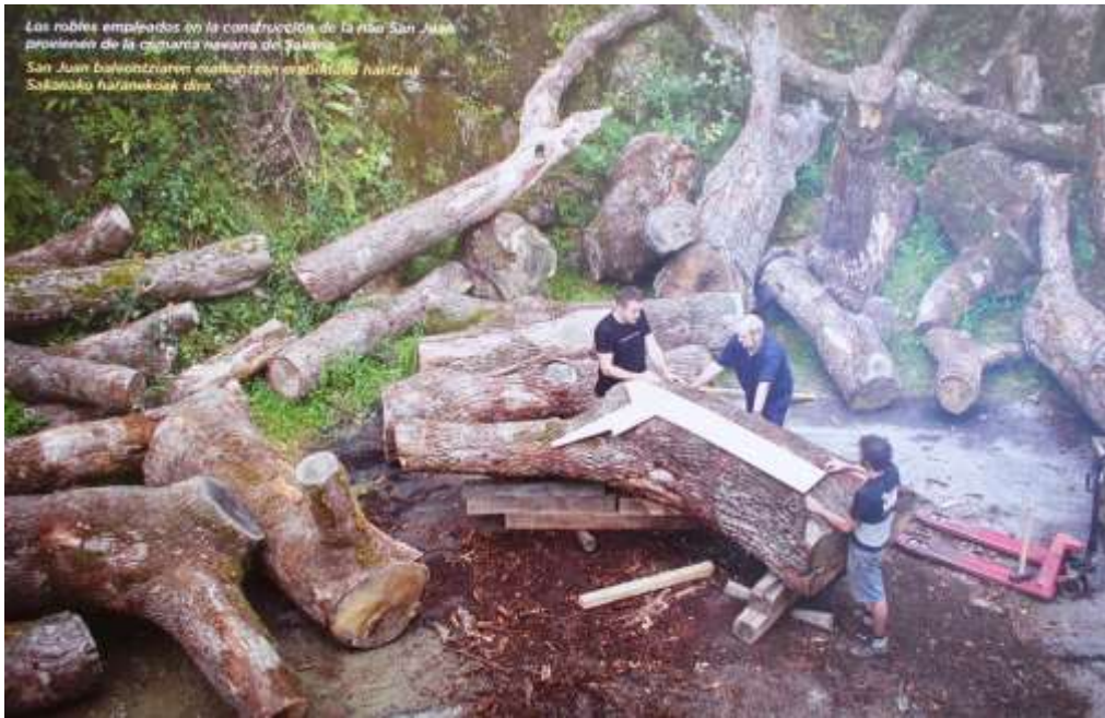
“Os carvalhos empregues na construção da réplica da nau São João, são provenientes da comarca navarra de Sakanako”