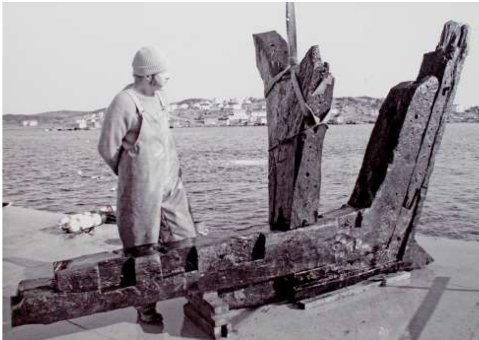
Componentes da nau resgatados em Red Bay.