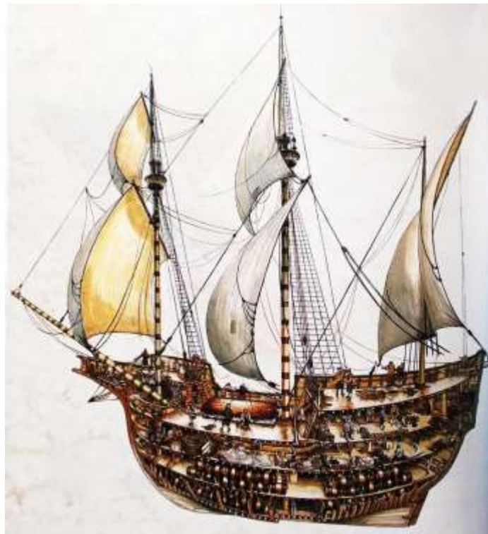
Baleeiro São João

O baleeiro São João é, hoje em dia, o melhor exemplar conhecido a nível mundial dos primeiros cargueiros transoceânicos da história. Desenhado no País Basco, é uma nau concebida para cruzar o oceano Atlântico com êxito e com o porão cheio.