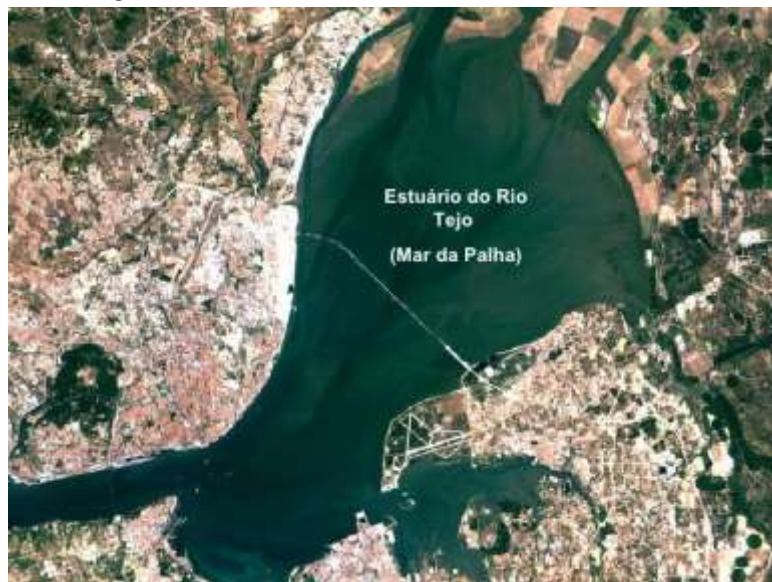
“O Mar da Palha”

Não querendo alongar-me por aqui volto ao Tejo, mais propriamente ao final da sua grande viagem, onde ele é circundado por um conjunto de povoações cuja história é marcada por esta massa de água conhecida também como Mar da Palha , pergunto: como foi e é feito esse diálogo terra/homens e água?