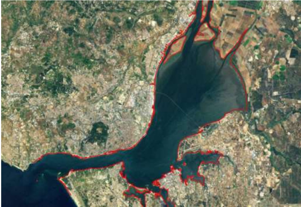
Imagem aérea do Estuário do Tejo. A vermelho está assinalada a Reserva Natural do Estuário do Tejo .