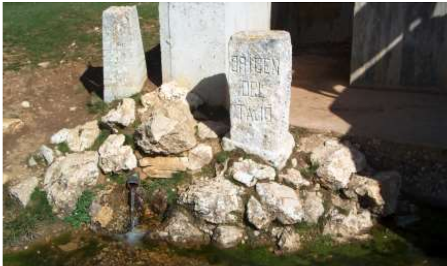
“Origem do Tejo”, em Albarracim.

Depois de percorridos 1038 km, dos quais 230 km em território português, desde a sua nascente em terras de Espanha, na Serra de Albarracim - em Muela de San Juan - o Tejo chega e espraia-se como um mar na sua foz, em terras de Portugal.